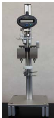
バックラッシュ測定器